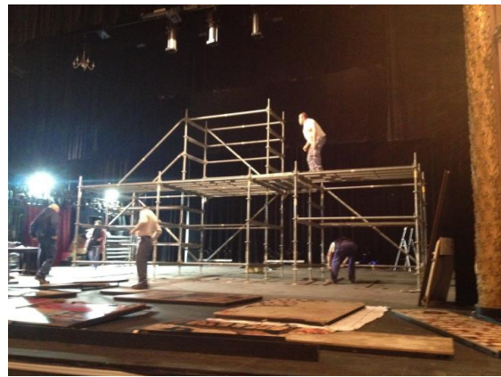
Photos du décor